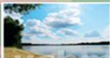
Испарение с реки