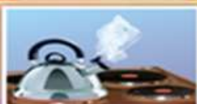
В чайнике вода кипит — Пар из чайника шипит