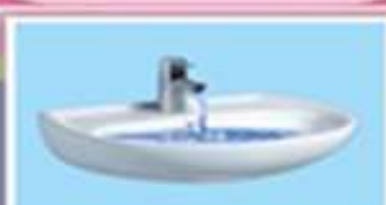
Вода в раковине, ванне и в водопроводе